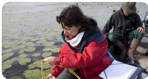
Réserve naturelle de Grand-Lieu