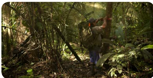
Parc amazonien de Guyane