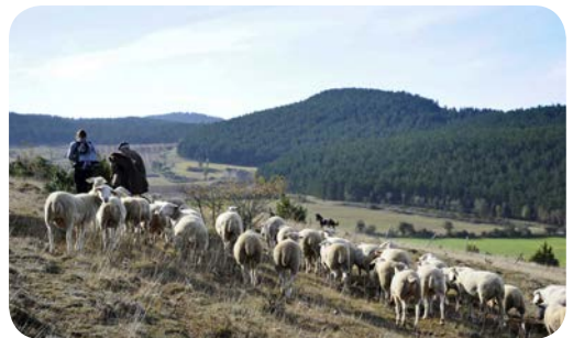
Parc national des Cévennes

Comment organiser de façon optimisée le stockage, les transferts, le traitement et l'analyse de quantités de données considérables ? Quels dispositifs de centralisation ? Quel statut pour ces données ? Comment rendre les données publiques accessibles ? Quel développement de logiciels libres pour les interfaces ? Quelle formation pour tous ceux qui ont besoin d'accéder à la donnée ?