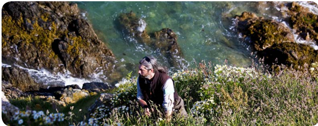
Réserve naturelle des Sept-Îles